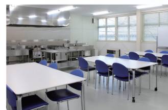
プレゼンテーションルーム