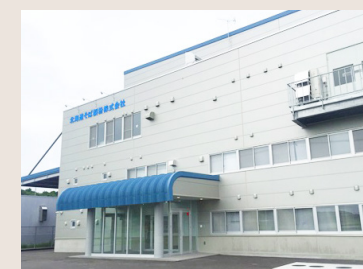
| 北海道そば製粉株式会社